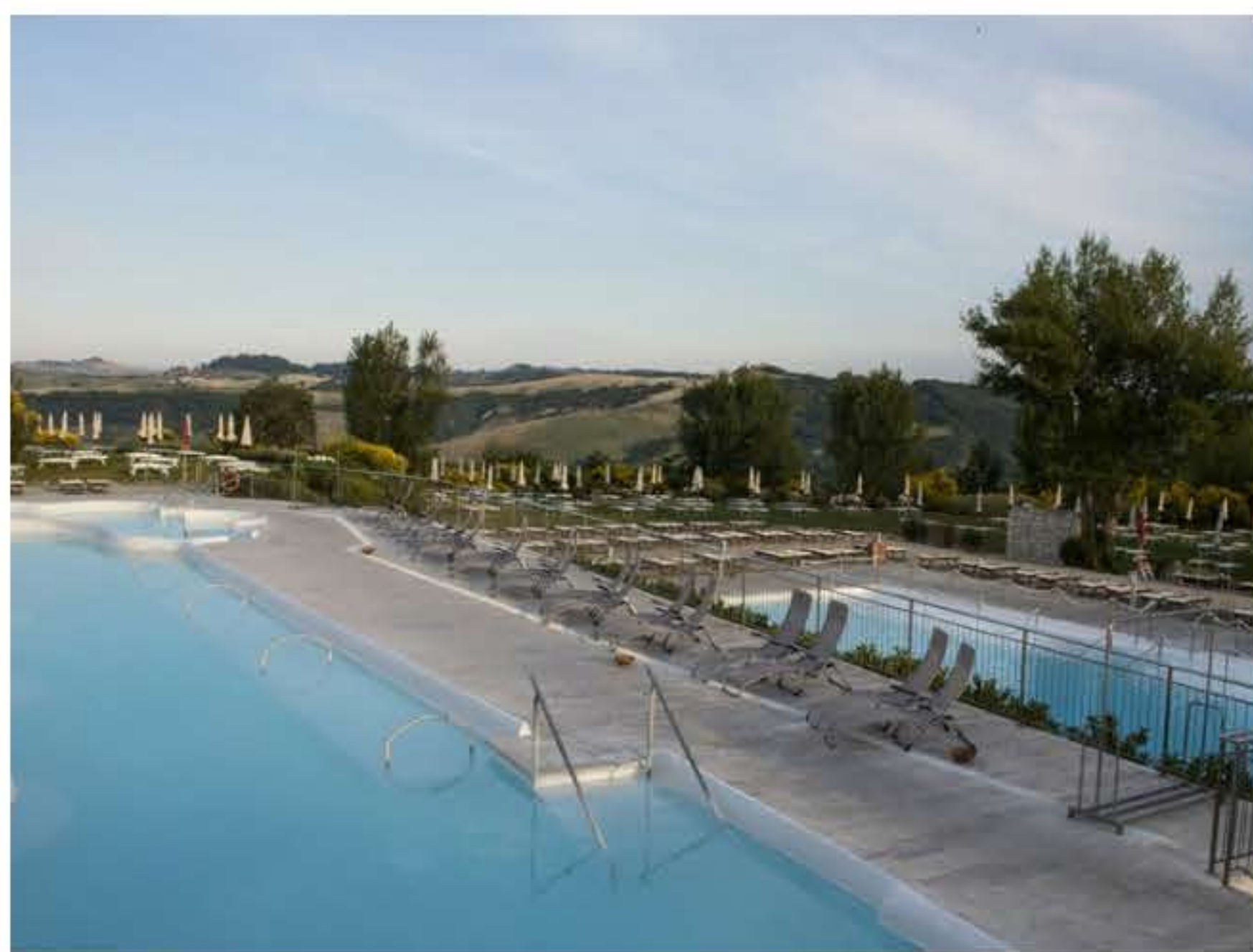
Le sedute Fiam immerse nel paesaggio toscano